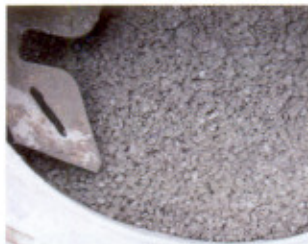
Monokornmörtel 2-8 mm im Freifallmischer