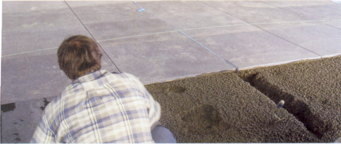
Verlegung auf frischem estrichgerechten Monokorn-estrich.

Erreichen der notwendigen Bruchkraft erlaubt.